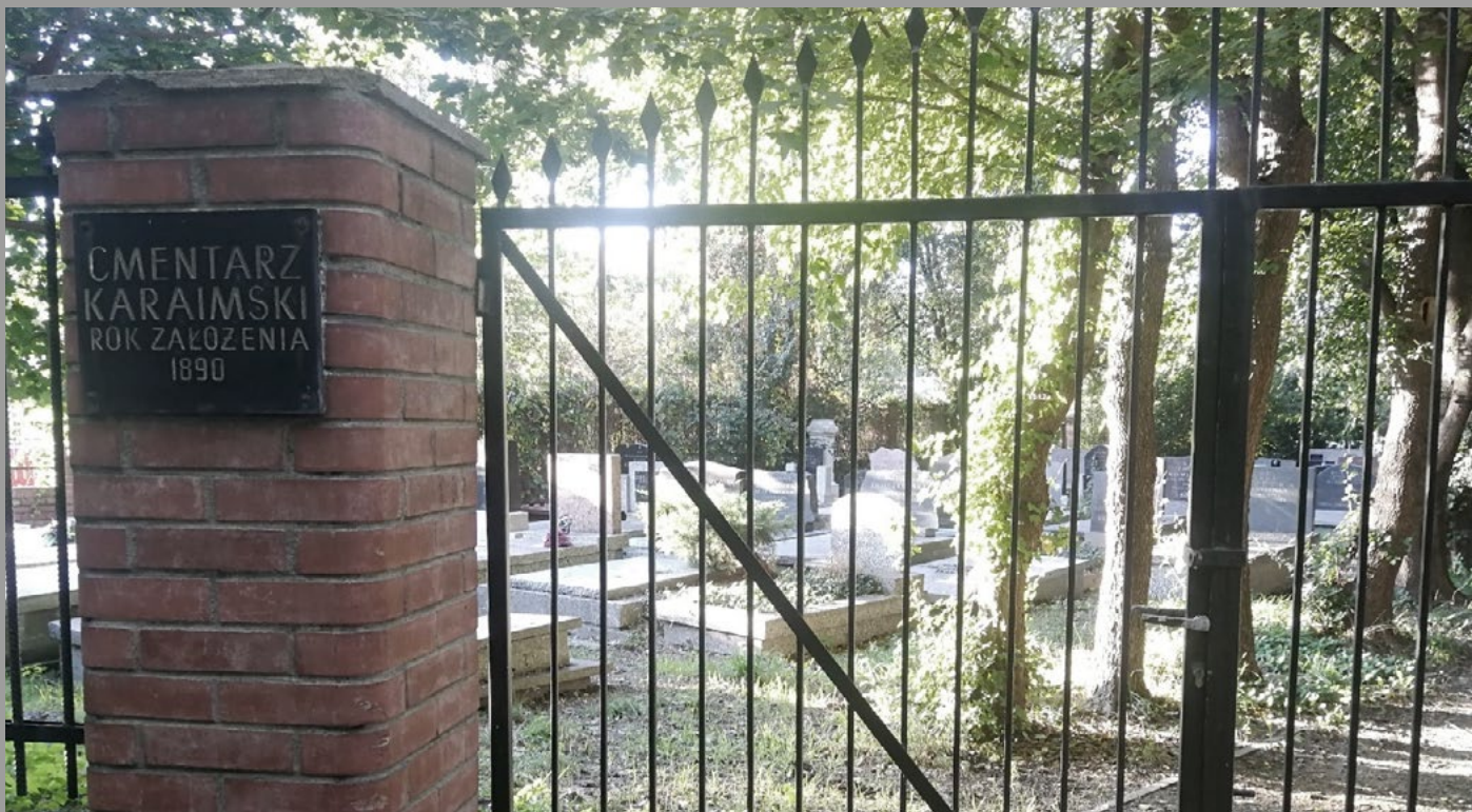
Brama cmentarza karaimskiego w Warszawie