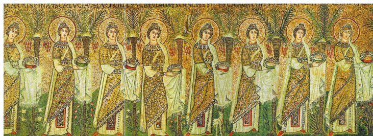
Męczennicy i męczennice, mozaiki z bazyliki św. Apolinarego z Rawenny (V/VI w.)