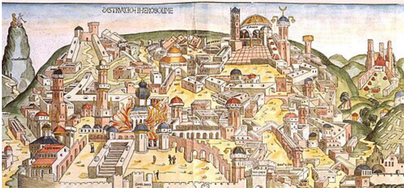
Zniszczenie Jerozolimy przez Chaldejczyków, ilustracja z tzw. Kroniki norymberskiej (1493).

niegodziwością, tym, że poganie wszelkimi sposobami, czcząc i kłaniając się bałwanom bezczeszczą kraj ofiarowany narodowi izraelskiemu. Gdy nastąpił na niego dziki zwierzęta, lwy i niedźwiedzie, które zjadały ludzi i ich stada.... I o tym, jak król asyryjski zaskoczony niemożnością odwrócenia gniewu Bożego, za radą znajdujących się w Asyrii zniewolonych kapłanów i lewitów, wysłał do Samarii uczonych w prawie i Piśmie świętym Izraelitów, aby nauczili zamieszkujących w Samarii Asyryjczyków przestrzegać praw danych przez Boga Mojżeszowi dla narodu izraelskiego. Gdy król tak postąpił, dzikie zwierzęta zniknęły jakby za skinieniem Bożej ręki i krainę tę można było zasiedlać.