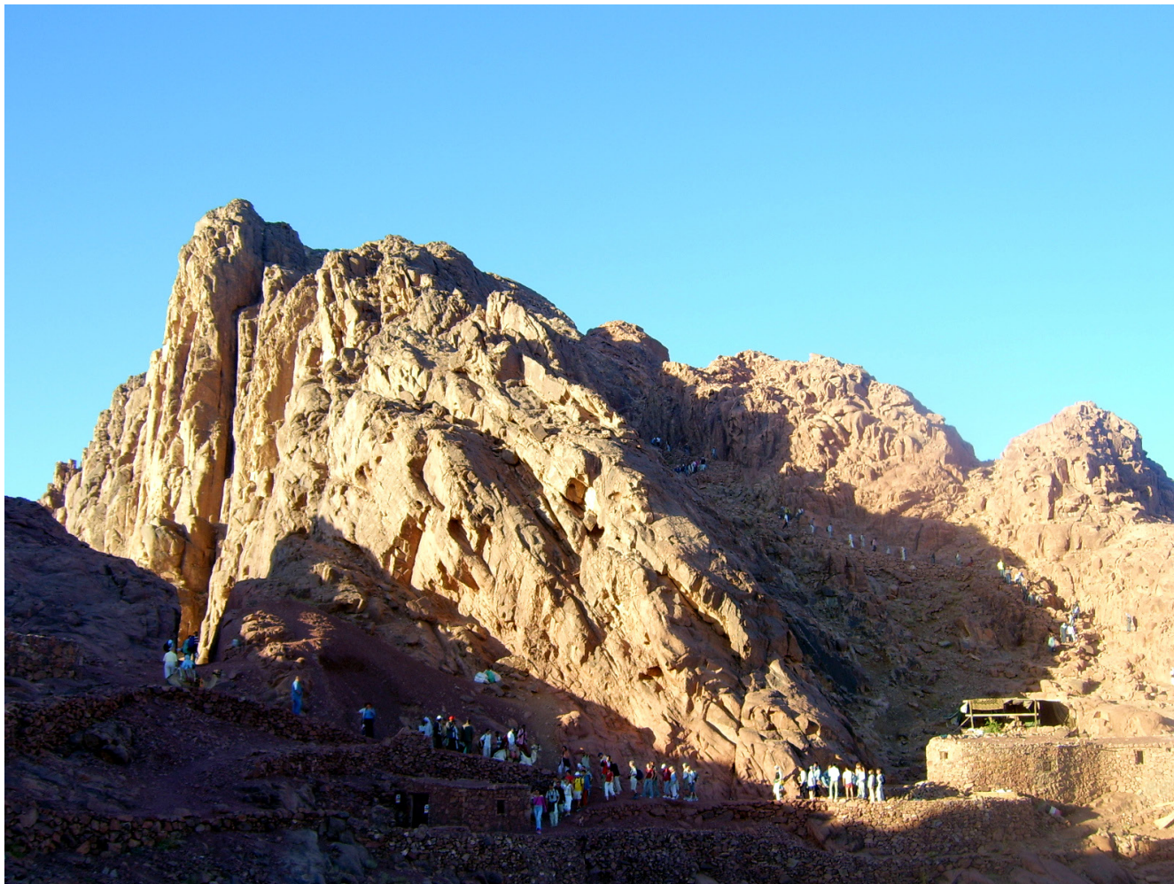
Na zdjęciu po lewej stronie i powyżej: Góra Synaj

łaską Bożą. Ojciec Porfiriusz, w charakterystyczny dla siebie sposób, mówił, że kiedy starał się w zwykłej miejscowości osiągnąć poprzez modlitwę duchowe uniesienie, to potrzebował na to powiedzmy kwadrans lub pół godziny modlitewnego wysiłku i walki. Kiedy natomiast modlił się na świętym miejscu, to wszystko wyglądało zupełnie inaczej. Wchodzę na przykład – opowiadał – do świętej pieczary takiej jak jaskinia świętego mnicha Nifonta lub świętego mnicha Niła na Świętej Górze, lub jaskini Apokalipsy... Jeszcze nie zdążyłem rozpocząć modlitwy, gdy już samo to uświęcone miejsce odrywa mnie od ziemi.