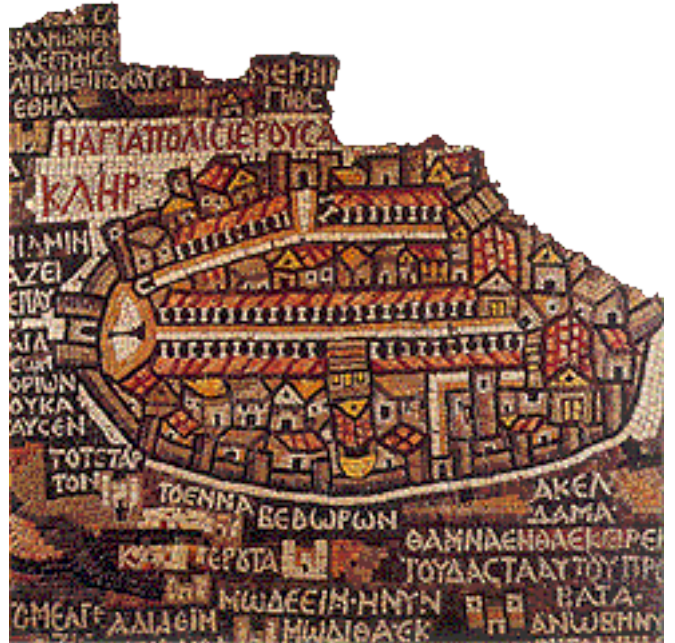
Mozaika przedstawiająca Jerozolimę na posadzce cerkwi św. Jerzego z VI wieku, Madaba (Jordania);

To, że Ojcowie Cerkwi Bożej nie tracą świętości, która się w nich utrzymuje, tobie, człowiekowi odczytanemu i zgłębiającemu Pismo Święte – jest znane. Wiele lat upłynęło od czasów izraelskiego króla Salomona, do zburzenia przez Babilończyków królewskiego miasta Jerozolimy i zniewolenia całego narodu żydowskiego... A w tym czasie różnymi niezwykle niegodziwymi sposobami wspaniała świątynia Boża była bezczeszczona,